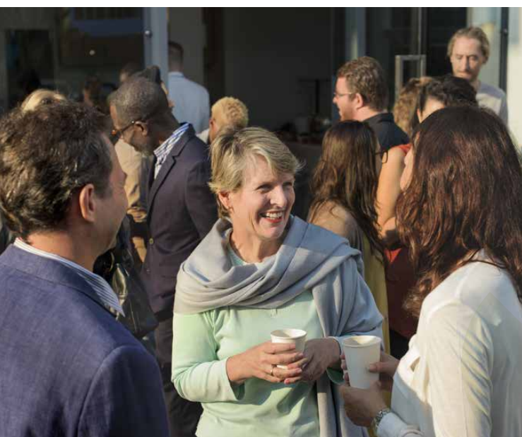
Kennisuitwisseling en -deling in het Fredeshiemoverleg .

De afdeling Bestuur & Organisatie bestaat uit een team deskundige beleidsadviseurs met diverse specialisaties. Mensen met verstand van zaken en hart voor onderwijs. Zij ondersteunen besturen op strategisch en tactisch niveau bij het professionaliseren van de organisatie, in al haar facetten. De beleidsadviseurs staan klaar als klankbord, meedenker, omdenker en uitdenker en kunnen eveneens helpen bij de uitvoering.